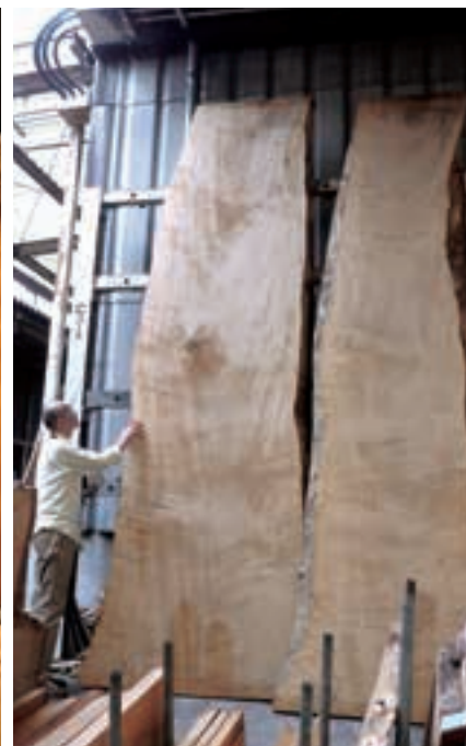
松葉屋が森になりました